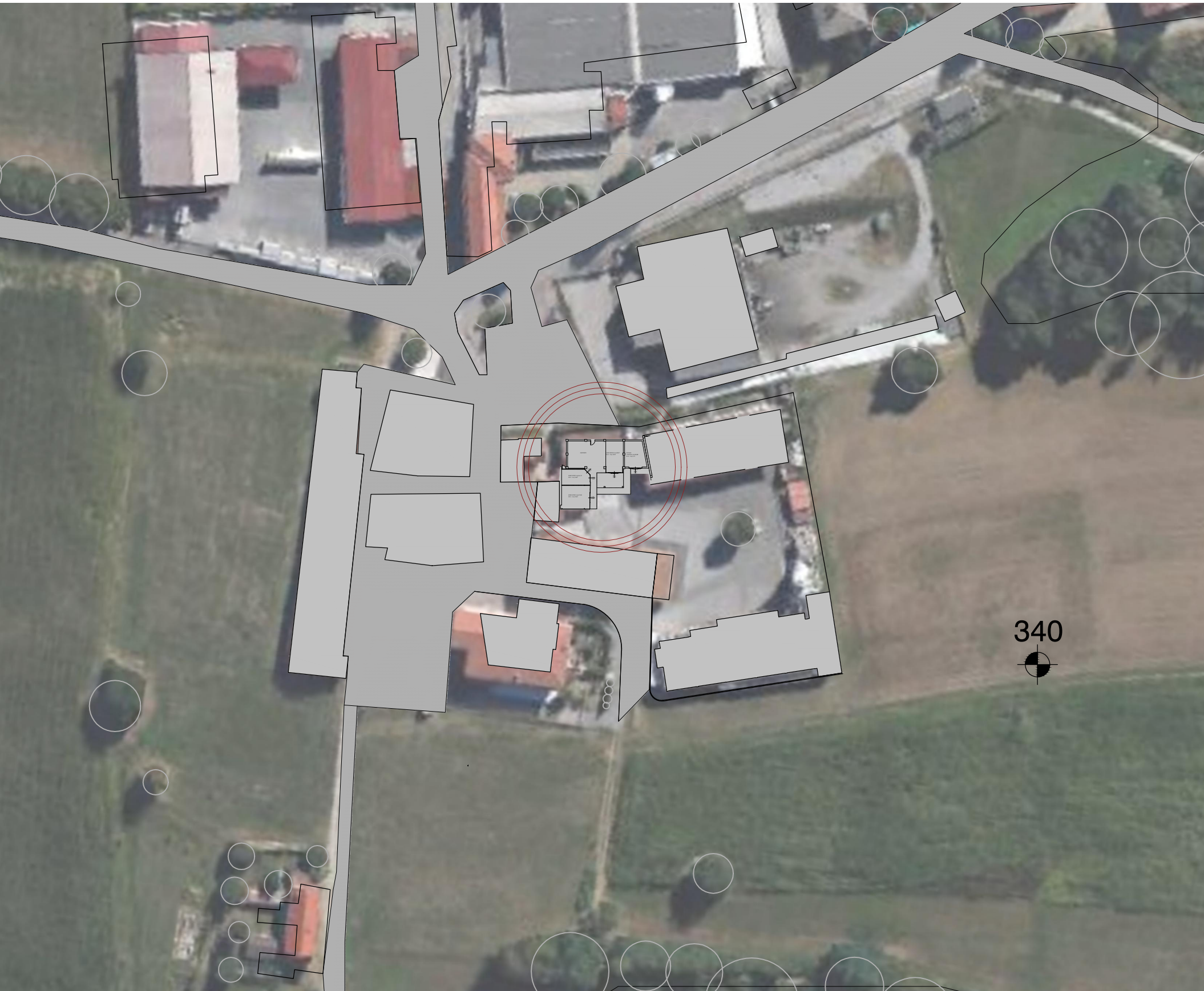
planimetria generale scala 1:1000